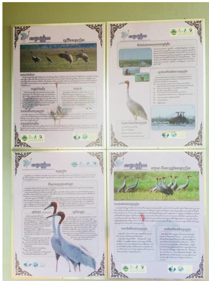
ផ្លាស់ព័ត៌មានដែលបរិយាយអំពីទីជម្រកសត្វក្រៀម អេកូឡូស៊ី វដ្តជីវិត និងកត្តាគំរាមកំហែង