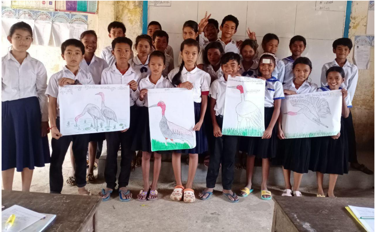
កម្មវិធីអប់រំស្តីពីសត្វក្រៀល បរិស្ថាន និងតំបន់ជីវសាស្ត្រសម្រាប់សាលាបឋមសិក្សា