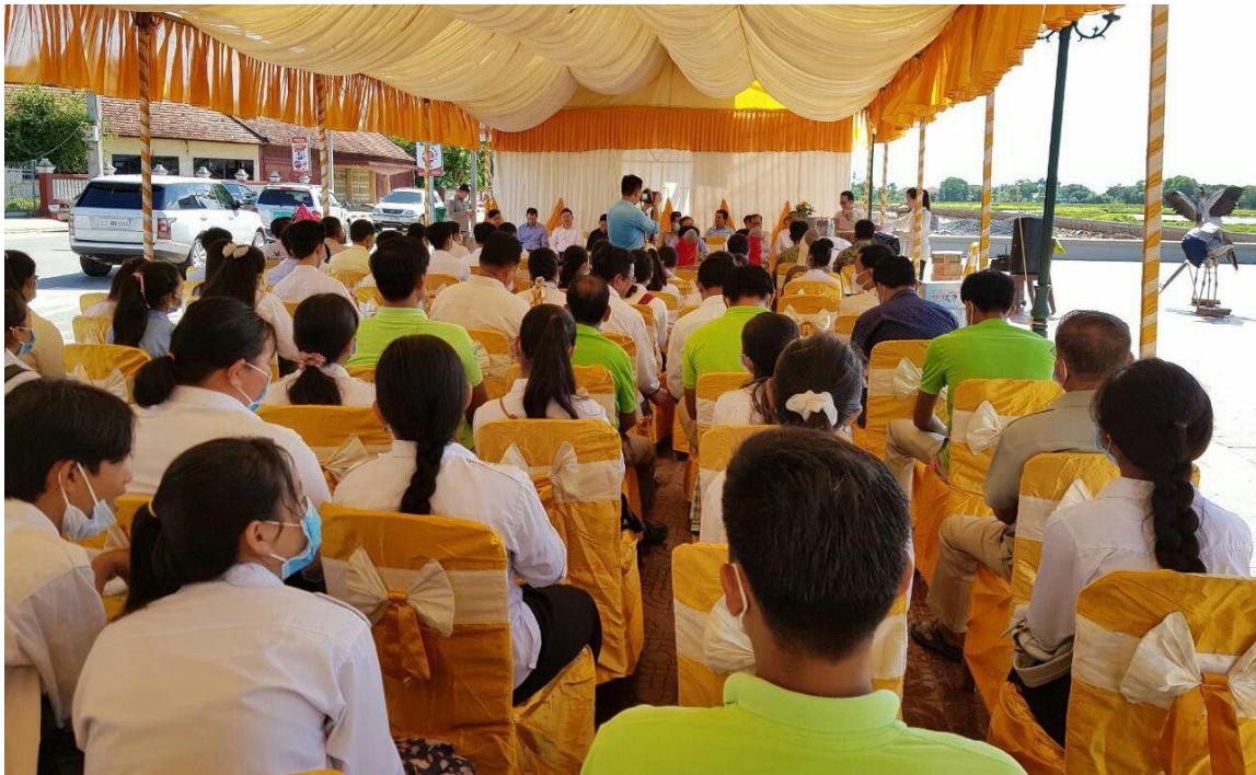
ទិវាសត្វស្លាបទេសន្តរប្រវេសន៍ ឆ្នាំ២០២០

ប្រភេទសត្វកម្រនេះដែលមានវត្តមានជាប្រចាំចាប់ពីខែធ្នូដល់ខែកុម្ភៈ នៅតំបន់ការពារ ទេសភាពបឹងព្រែកល្អៅ ដែលស្ថិតនៅស្រុកបូរីជលសារ និងកោះអណ្តែត នៃខេត្តតាកែវ។