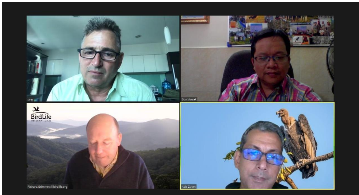
គណកម្មការអង្គការBirdLife International សំរាប់គាំទ្រ និងជ្រើសរើសដៃគូនៅកម្ពុជា