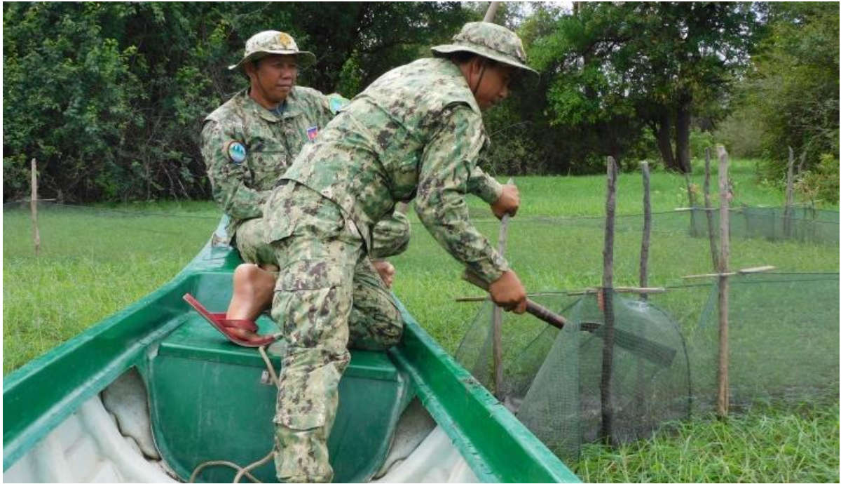
ឧទ្យានុកម្មល្អិតប្រចាំខែ