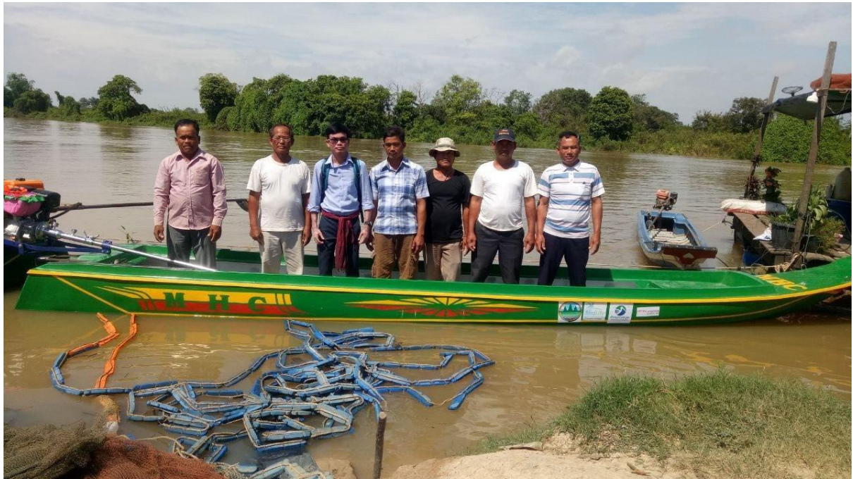
ប្រគល់ទូកមានម៉ាស៊ីន ដល់សហគមន៍