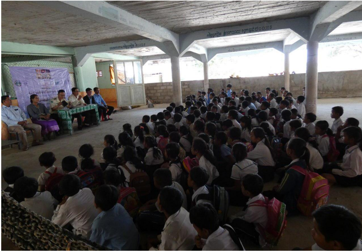
រៀបចំទិវាតំបន់ដីសើមពិភពលោកក្នុងខែកុម្ភៈឆ្នាំ២០២០ នៅសាលាចំនួនបី