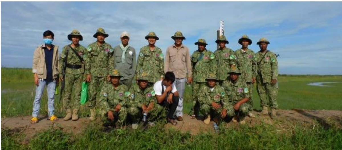
ទស្សនៈកិច្ចសិក្សាទៅតំបន់ការពារទេសភាពបឹងព្រែកល្អិត