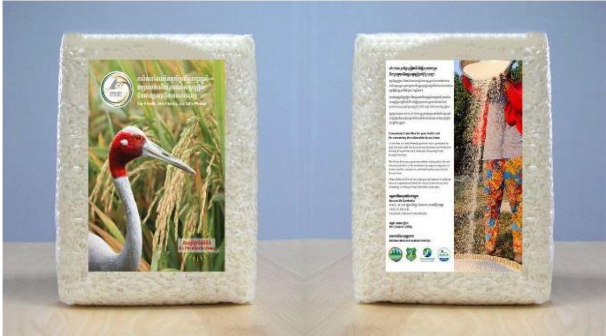
យីហោអង្ករមិត្តភ្ញៀវត្រូវបានចនា និងបោះពុម្ពលើសំភារៈវេចកញ្ចប់