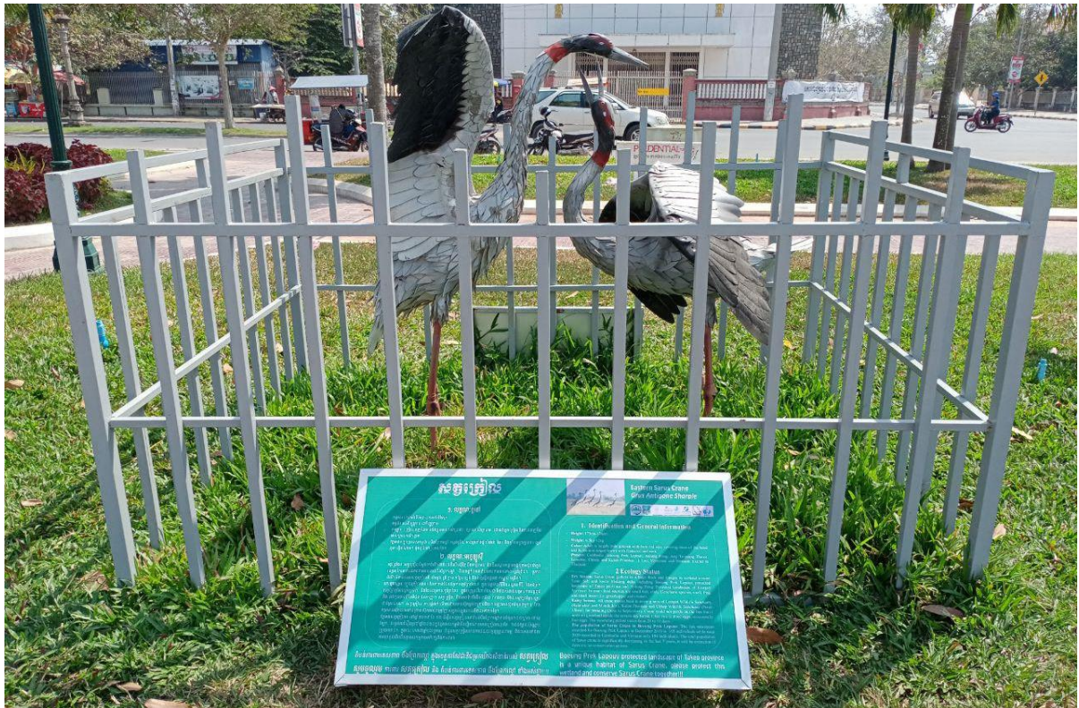
សត្វក្រៀមមួយគូដាក់តាំងក្នុងសួនច្បារសាធារណៈ