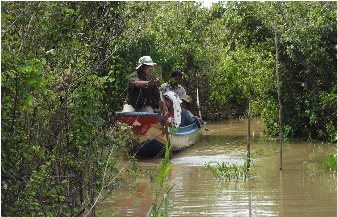
សហគមន៍ល្អិតប្រចាំខែ