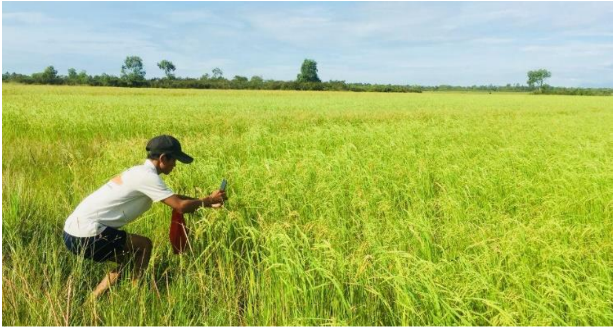
ការដាំស្រូវ សំបកកន្ទឹម និងពងលលកដោយកសិករចំនួន៣គ្រួសារនៅទីតាំងដីជួល