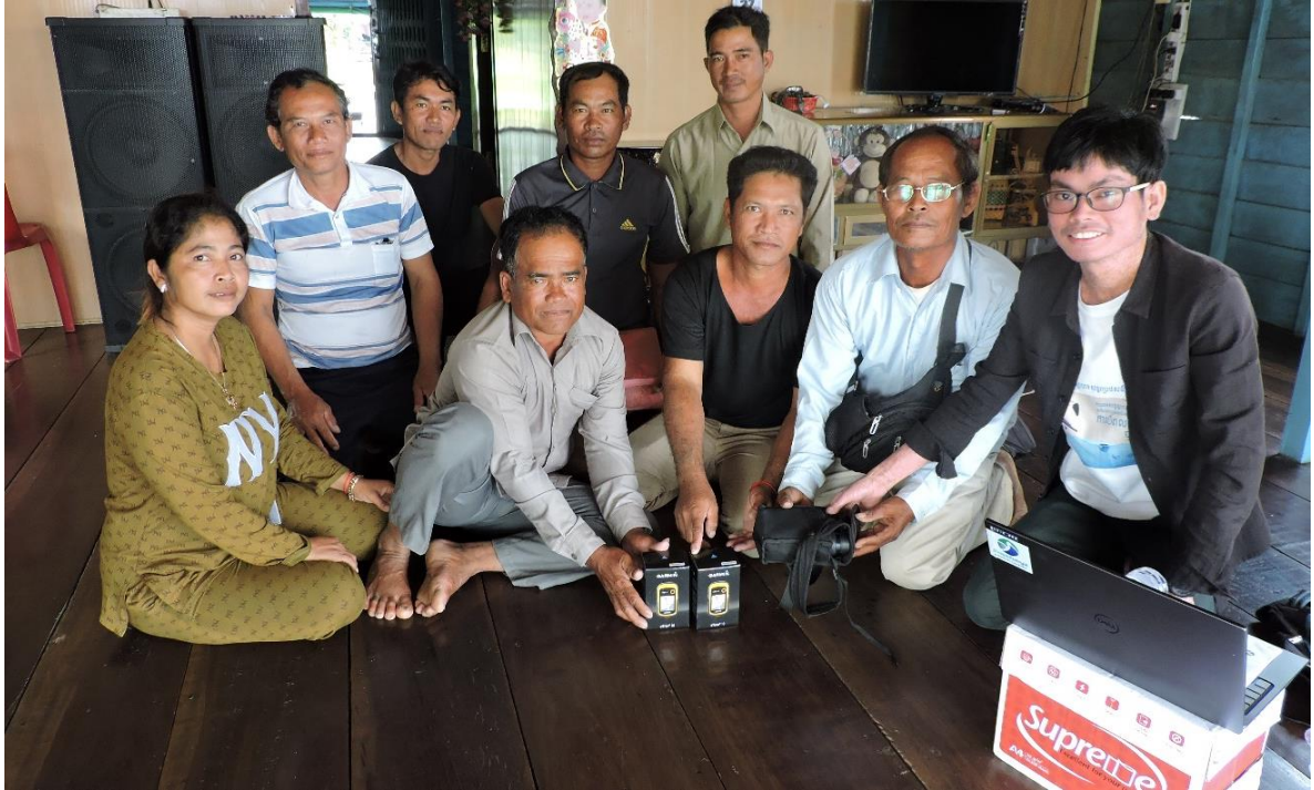
ការប្រគល់ជូន GPS និងកែវយឺត ដល់សហគមន៍