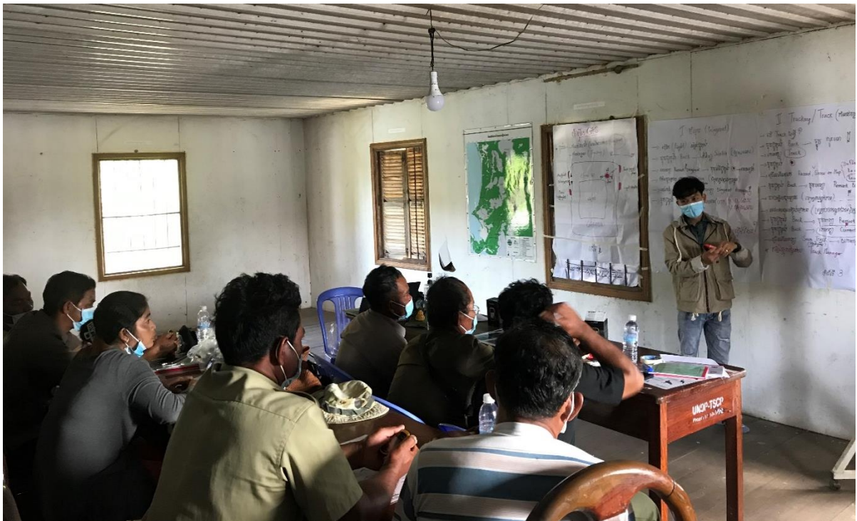
បណ្តុះបណ្តាលសហគមន៍ស្តីពីការប្រើប្រាស់ GPS កែវយឺត ការប្រមូលទិន្នន័យជីវៈចម្រុះ និងការធ្វើ របាយការណ៍