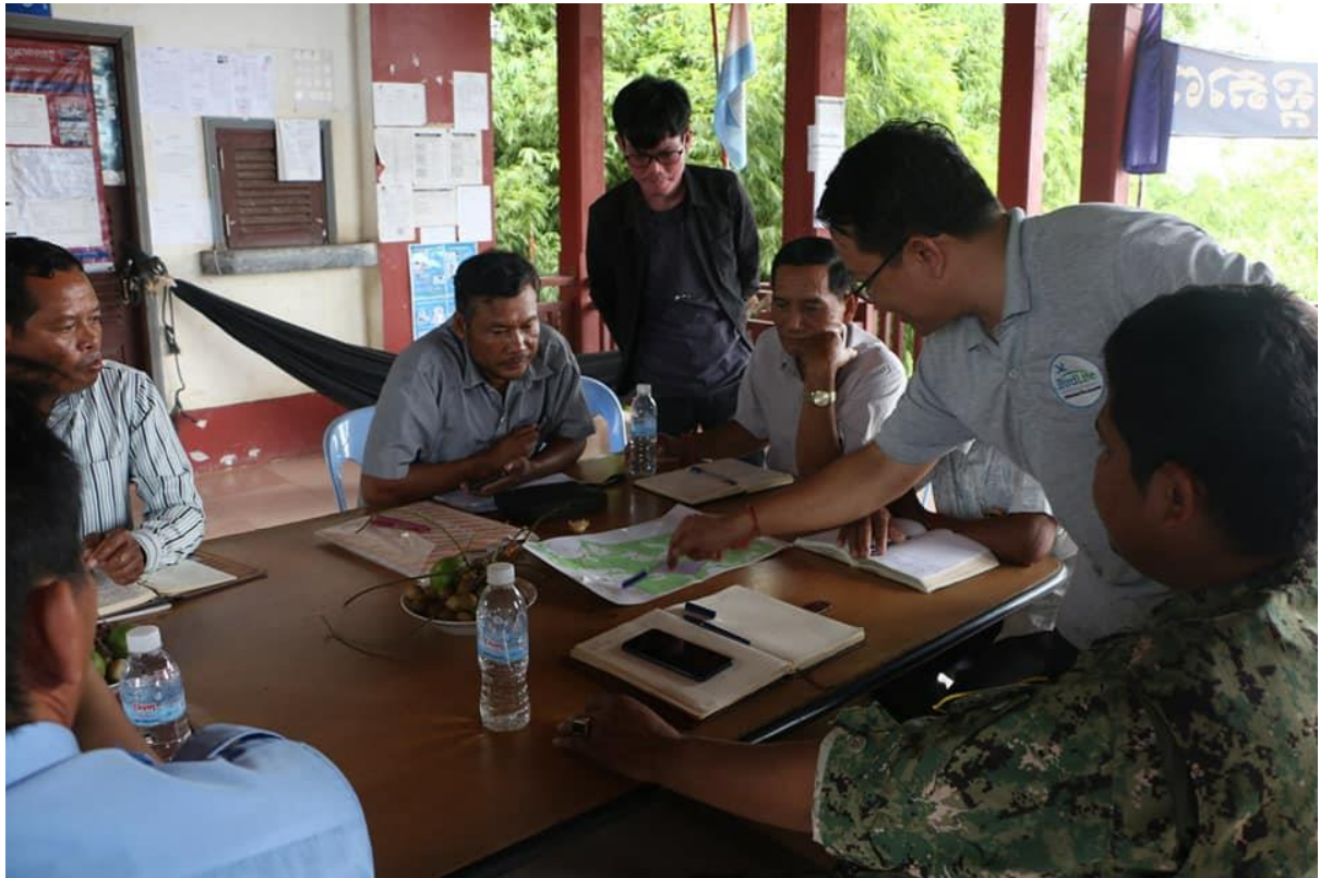
អង្គប្រជុំជំរកភាពក្នុងការបង្កើតសហគមន៍តំបន់ការពារធម្មជាតិថ្មីមួយទៀត