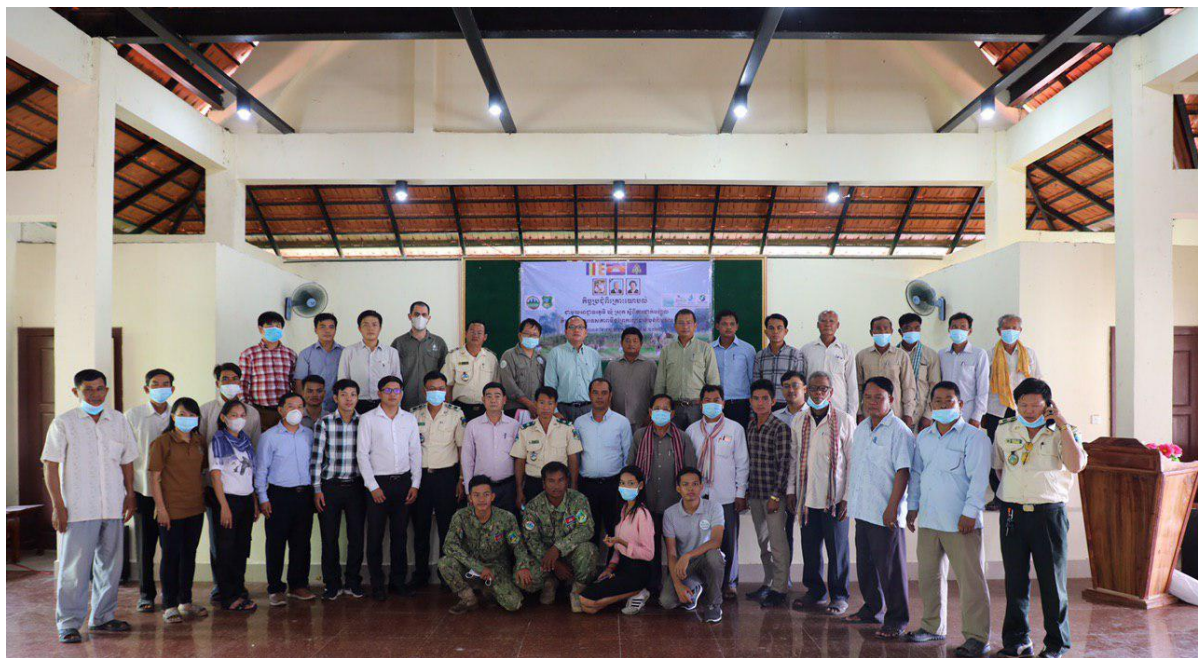
កិច្ចប្រជុំពិភាក្សាថ្នាក់ឃុំ និងស្រុកក្នុងការដាក់តំបន់ការពារទេសភាពបឹងព្រែកល្អៅជាតំបន់វារីសារថ្មី របស់ប្រទេសកម្ពុជានៅទីរួមស្រុកកោះអណ្តែត