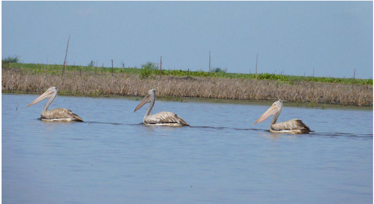
សត្វទូងប្រទេសដែលកត់ត្រាក្នុងពេលល្អិត