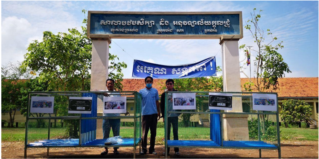
ផ្តល់ជូនសំរាមដល់សាលាសាលាក្នុងជ្រុំ សាលាសង្គមមានជ័យ និងសាលាបន្ទាយឆ្មាយ