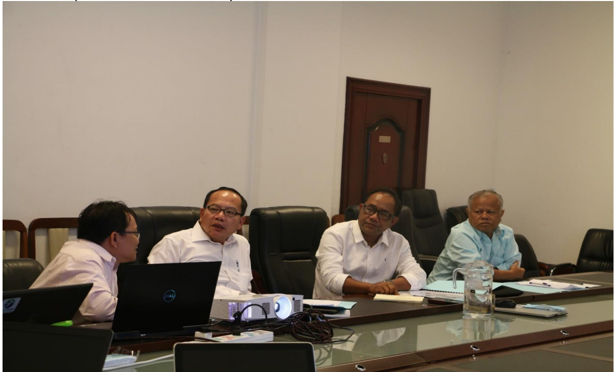
ប្រជុំក្រុមប្រឹក្សាភិបាលរបស់អង្គការជីវិតធម្មជាតិនៅកម្ពុជាប្រចាំឆមាស