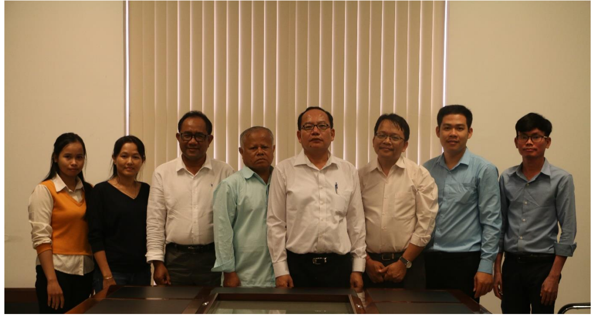
កិច្ចប្រជុំក្រុមប្រឹក្សាភិបាលអង្គការជីវិតធម្មជាតិនៅកម្ពុជា លើកទី៥ក្នុងឆ្នាំ២០២០