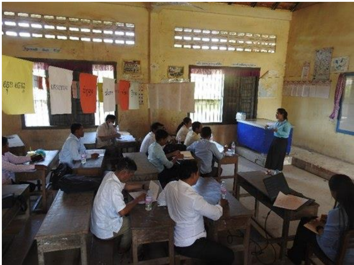
លោកគ្រូ និងអ្នកគ្រូចំនួន១២នាក់ទទួលបានការបណ្តុះបណ្តាល