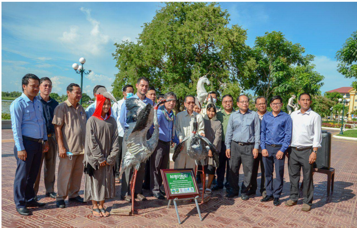
ទិវាសត្វស្លាបទេសន្តរប្រវេសន៍ ឆ្នាំ២០២០