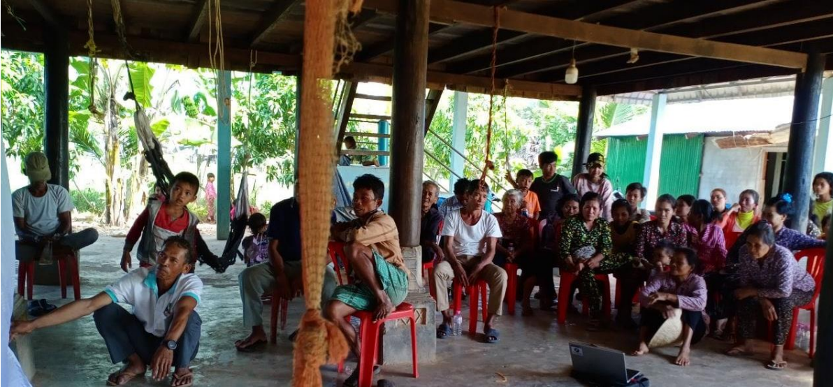
រៀបចំកម្មវិធីបញ្ជាំងវិឌីអូអប់រំផ្សព្វផ្សាយស្តីពីសត្វក្រៀល និងកិច្ចអភិរក្ស