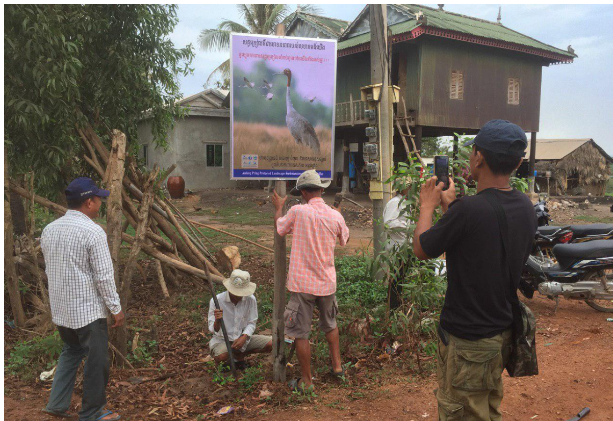
លើកផ្លាកផ្សព្វផ្សាយស្តីពីសារសំខាន់របស់សត្វក្រៀលផ្សាភ្ជាប់ និងជីវភាពរបស់សហគមន៍