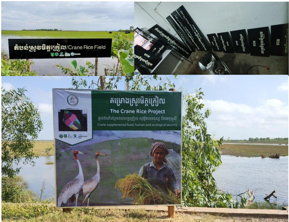
ព្រំប្រទល់ និងផ្ទាំងព័ត៌មានស្តីពីស្រូវមិត្តក្រៀលចំនួន១៧ផ្នែកត្រូវបានដំឡើង