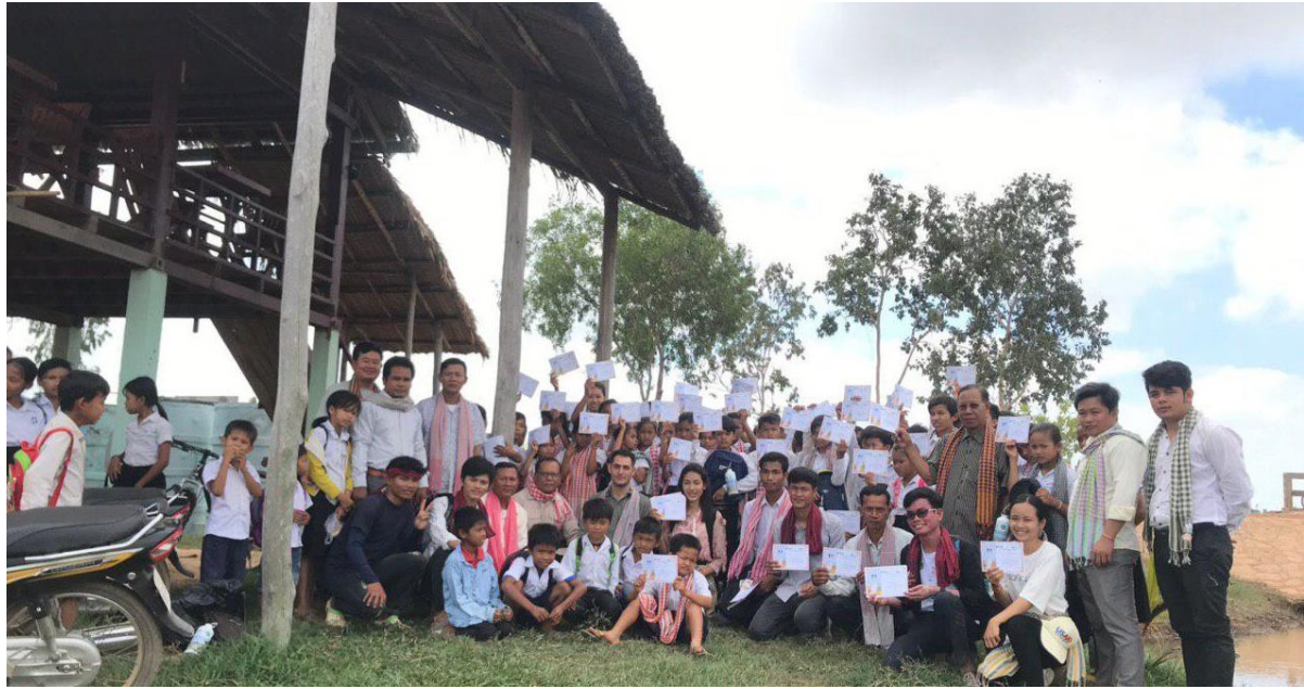
រៀបចំទិវាតំបន់ដីសើមពិភពលោកដោយសហការជាមួយអង្គការWWF និងអង្គការជីវិតសត្វស្លាប អន្តរជាតិនៅសាលាបឋមសិក្សាថ្មបើក