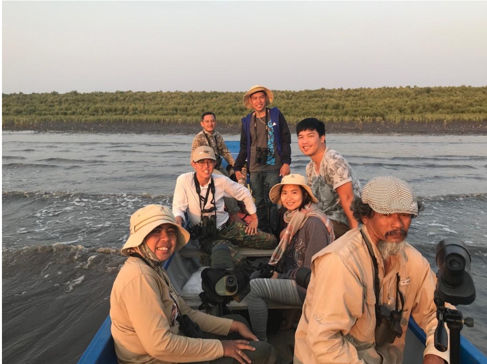
សកម្មភាពចុះសិក្សាសត្វស្លាបទេសន្តរប្រវេសន៍ នៅតំបន់រ៉ាមសារកោះកាពិ