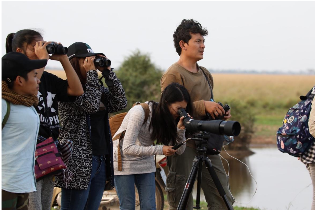
សកម្មភាពការមើលសត្វក្នុងទឹកតំបន់ជីវសាស្ត្រពិភពលោកឆ្នាំ ២០១៨