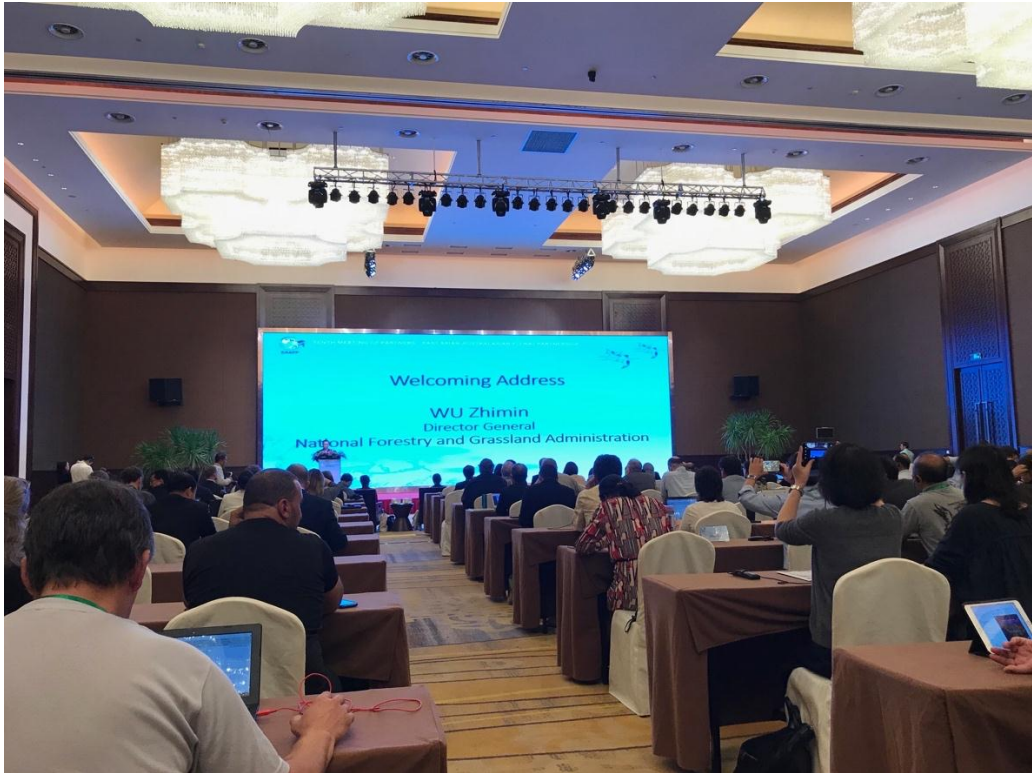
ចូលរួមកិច្ចប្រជុំដៃគូបណ្តាញផ្លូវហោះហើរសត្វស្លាបទេសន្តរប្រវេសន៍អាស៊ីខាងកើត អូស្ត្រាលី លើកទី១០