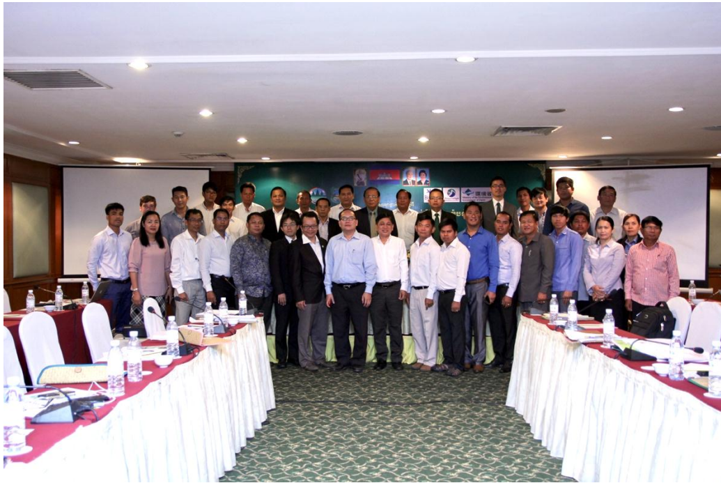
សិក្ខាសាលាថ្នាក់ជាតិស្តីពីការដាក់បញ្ចូលតំបន់ស្នូលស្ទឹងសែន និងតំបន់ជុំវិញជាតំបន់រ៉ាមសារស្ទឹងសែន