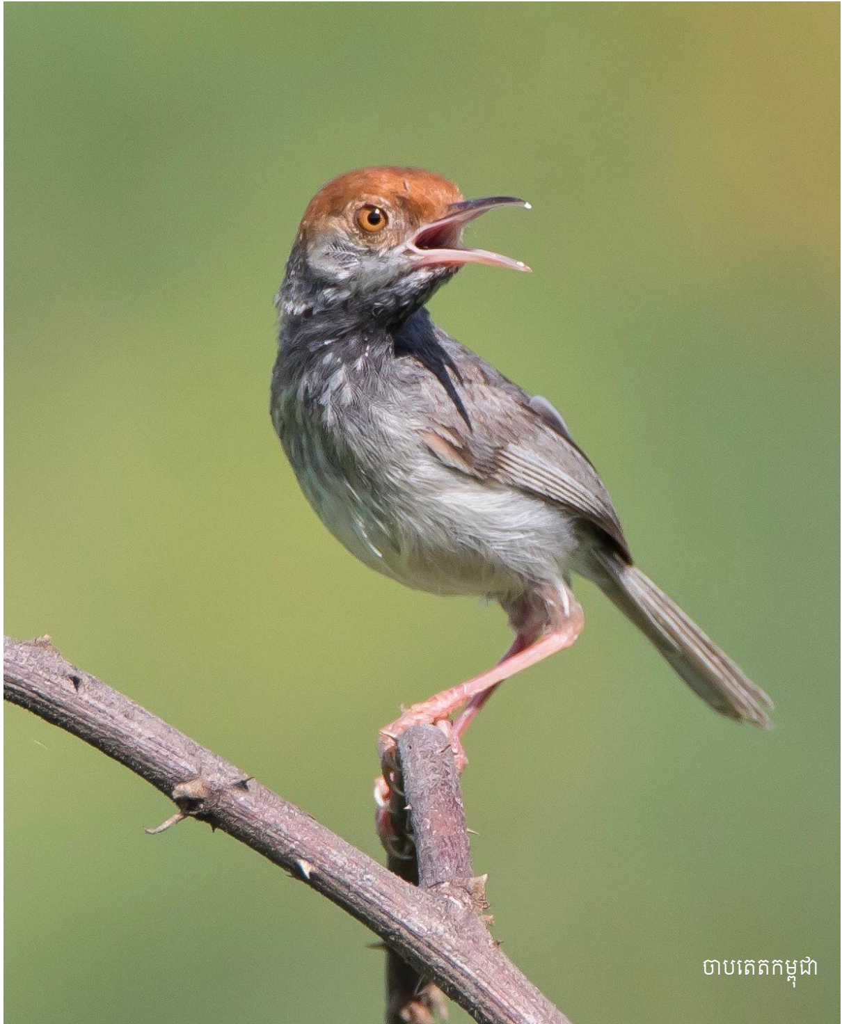
ចាបតេតកម្ពុជា