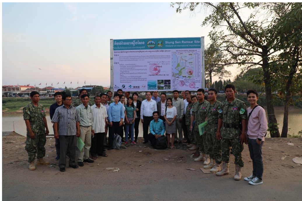
តំឡើងផ្ទាំងព័ត៌មានអំពីតំបន់រ៉ាមសារស្ទឹងសែន នៅខេត្តកំពង់ធំ