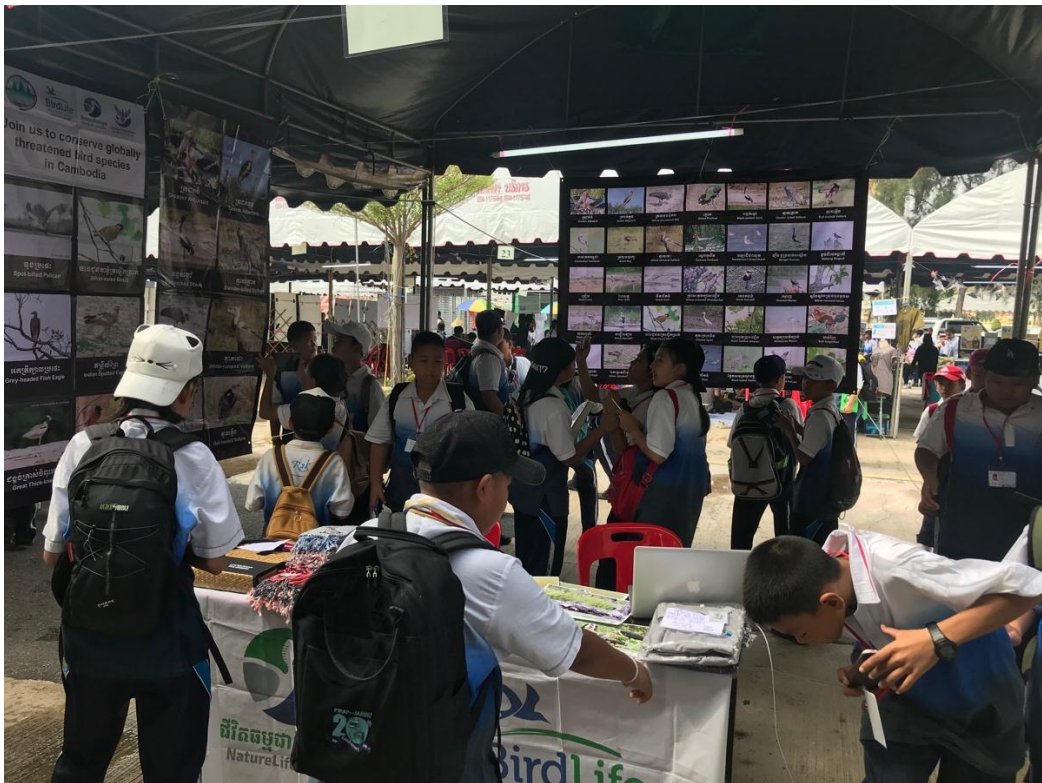
ស្តង់ក្នុងអង្គការជីវិតធម្មជាតិនៅកម្ពុជាក្នុងពិព័រណ៍សត្វស្លាបបៃ