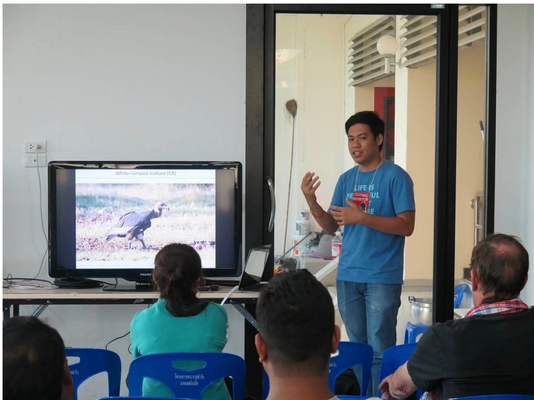
ការចែករំលែកបទពិសោធន៍ និងទេសចរណ៍ធម្មជាតិ នៅកម្ពុជា