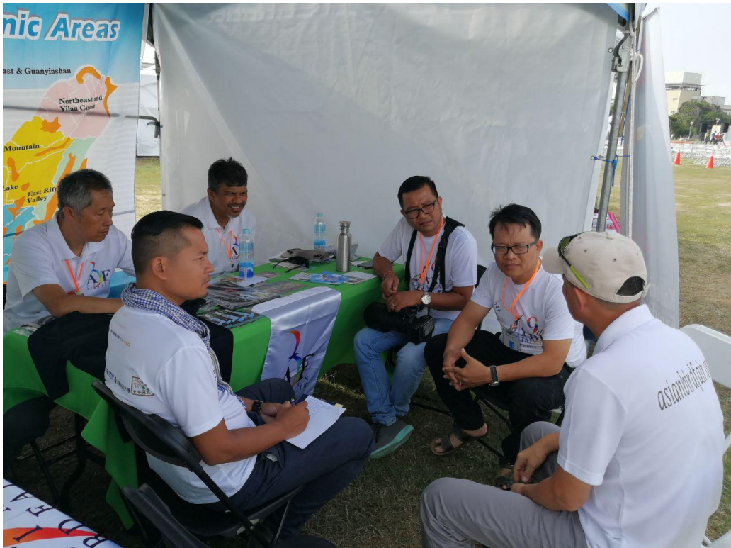
ការសិក្សាពីបទពិសោធន៍ក្នុងការរៀបចំព័ត៌មានសត្វស្លាប