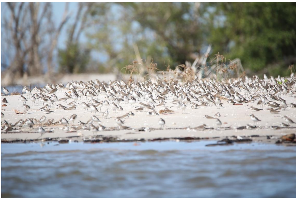
សត្វស្លាបទេសន្តរប្រវេសន៍ នៅតំបន់រ៉ាមសារកោះកាពិ