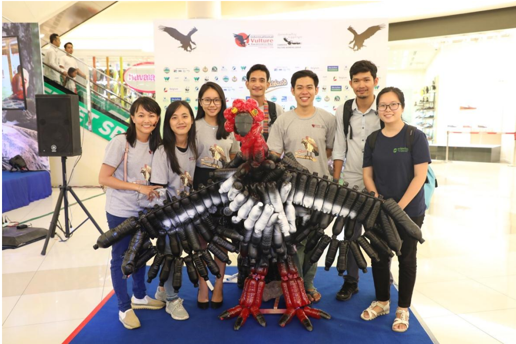
សកម្មភាពលើកកម្ពស់ការយល់ដឹងអំពីសត្វត្នាតនៅកម្ពុជា