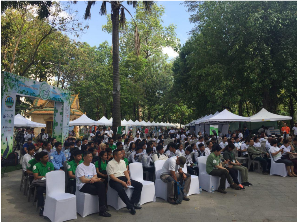
ពិព័រណ៍សត្វស្លាបកម្ពុជាលើកទី១