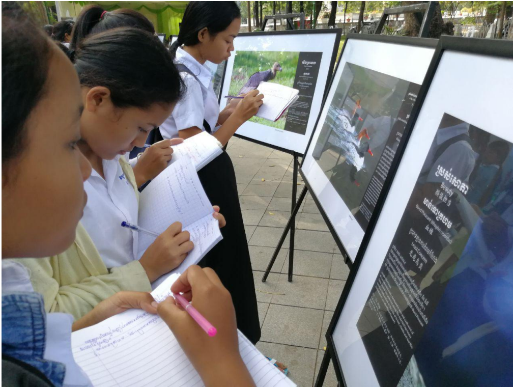
ការតាំងរូបភាពសត្វស្លាបក្នុងពិព័រណ៍សត្វស្លាបកម្ពុជាលើកទី១