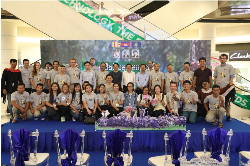
ក្រុមការងារមួយផ្នែកក្នុងកម្មវិធីលើកកម្ពស់ការយល់ដឹងអំពីសត្វគ្រោលនៅកម្ពុជា