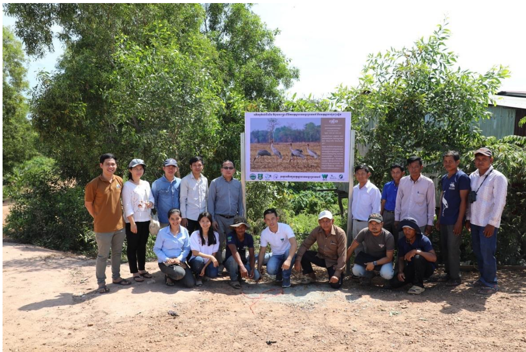
ការតំឡើងផ្ទាំងព័ត៌មានអំពីសត្វក្រៀល នៅតំបន់ការពារទេសភាពអាងត្រពាំងថ្ម