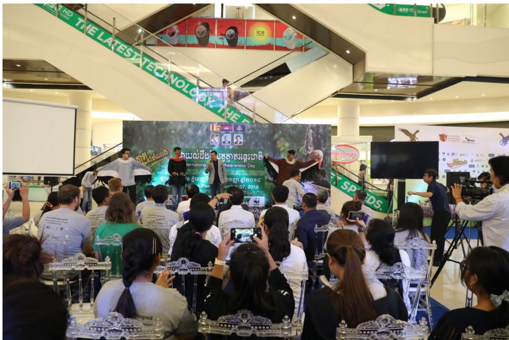
សកម្មភាពលើកកម្ពស់ការយល់ដឹងអំពីសត្វត្នាតនៅកម្ពុជា