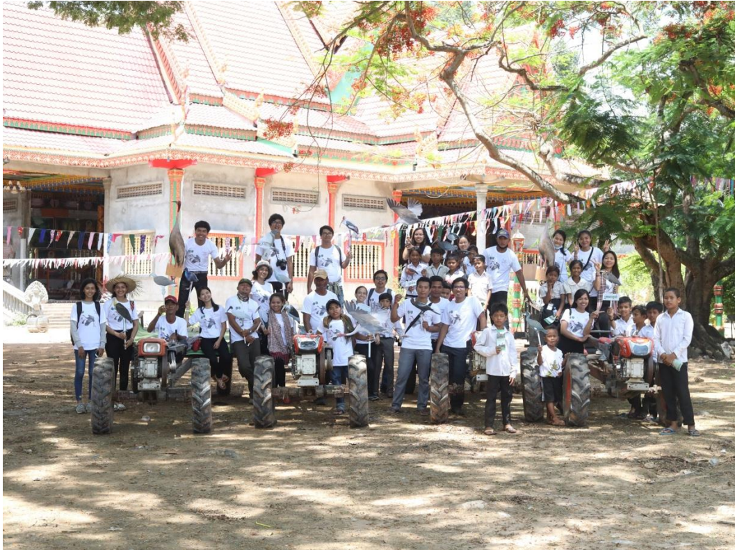
សកម្មភាពក្នុងទិវាសត្វស្លាប់ទេសន្តរប្រវេសន៍ឆ្នាំ ២០១៨ នៅតំបន់ការពារទេសភាពអន្លង់ព្រីង