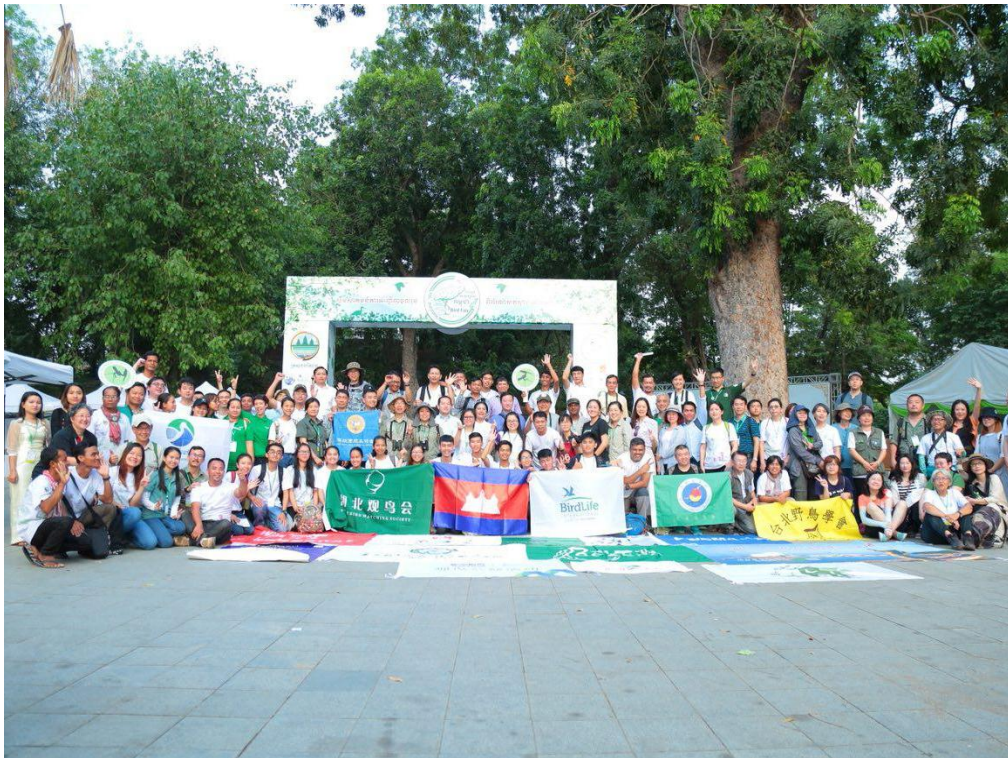
អ្នកចូលរួមតាំងពិព័រណ៍ក្នុងពិព័រណ៍សត្វស្លាបកម្ពុជាលើកទី១