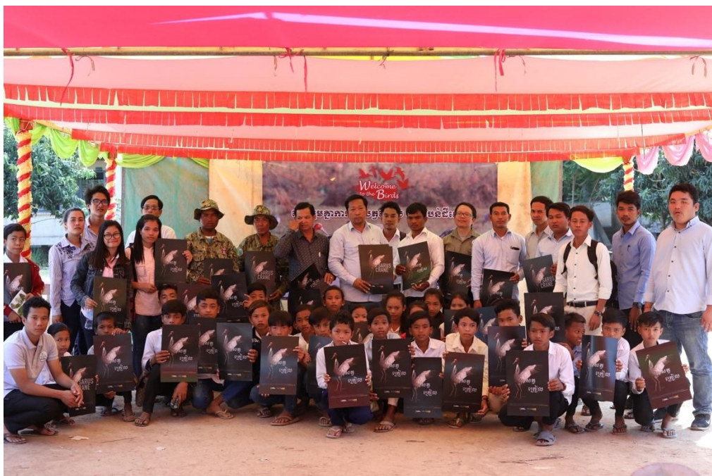
សកម្មភាពក្នុងការផ្សព្វផ្សាយអភិរក្សសត្វគ្រោល នៅតំបន់ការពារទេសភាពបឹងព្រែកល្អៅ