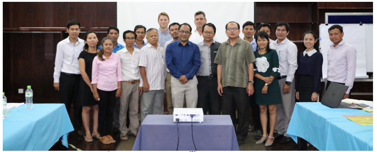
កិច្ចប្រជុំក្រុមប្រឹក្សាភិបាលអង្គការជីវិតធម្មជាតិនៅកម្ពុជា លើកទីមួយ

អង្គការជីវិតធម្មជាតិនៅកម្ពុជា គឺជាអង្គការក្នុងស្រុកខាងផ្នែកអភិរក្សដែលបានចុះបញ្ជីជាផ្លូវការក្នុងក្រសួងមហាផ្ទៃក្នុងខែ កុម្ភៈ ឆ្នាំ២០១៧។ អង្គការជីវិតធម្មជាតិនៅកម្ពុជា គឺជាអង្គការដែលមិនស្វែងរកប្រាក់កម្រៃជាឯកជន អព្យាក្រឹត មិនប្រកាន់ ពូជសាសន៍ មិនប្រកាន់សាសនា មិនប្រកាន់និន្នាការនយោបាយ មិនធ្វើនយោបាយ និងមិនផ្តល់មធ្យោបាយជាសម្ភារ ហិរញ្ញវត្ថុ ឬធនធានមនុស្សដើម្បីគាំទ្រគណបក្សនយោបាយ ឬមនោគមវិជ្ជាណាមួយឡើយ។ អង្គការនេះត្រូវបានបង្កើត ឡើងដោយមានការគាំទ្រយ៉ាងពេញទំហឹងពីអង្គការជីវិតសត្វស្លាបអន្តរជាតិ (BirdLife International) ក្រោមជំនួយផ្នែក ហិរញ្ញវត្ថុពី មូលនិធិភាពជាដៃគូសម្រាប់ប្រព័ន្ធអេកូឡូស៊ីទទួលរងការគំរាមកំហែង (CEPF) តាមរយៈអង្គការសហភាព អន្តរជាតិដើម្បីការអភិរក្សធម្មជាតិ (IUCN)។ អង្គការជីវិតធម្មជាតិនៅកម្ពុជា ត្រូវបានបង្កើតឡើងដោយស្ថាបនិក១២នាក់ ដែលក្នុងនោះ១០នាក់ គឺជាបុគ្គលិកស្នូលរបស់អង្គការជីវិតសត្វស្លាបអន្តរជាតិប្រចាំកម្ពុជា។ ការផ្តួចផ្តើមបង្កើតឡើងនេះ គឺជាផ្នែកមួយនៃយុទ្ធសាស្ត្រអន្តរកាលនៃការកសាងសមត្ថភាពអង្គការក្នុងស្រុករបស់អង្គការជីវិតសត្វស្លាបអន្តរជាតិដើម្បី អាចចាប់ជាដៃគូនាពេលអនាគត (គិតមកដល់បច្ចុប្បន្នអង្គការជីវិតសត្វស្លាបអន្តរជាតិមានដៃគូចំនួន ១២១ ក្នុងបណ្តា ប្រទេសនានាជុំវិញពិភពលោក)។ បន្ទាប់ពីការបង្កើតកម្មវិធីដោយផ្ទាល់នៅក្នុងវិស័យអភិរក្ស និងការកសាងសមត្ថភាព ដល់អ្នកអភិរក្ស និងបុគ្គលិកក្នុងស្រុកអស់រយៈពេលជាង១៥ឆ្នាំនៅក្នុងប្រទេសកម្ពុជា អង្គការជីវិតសត្វស្លាបអន្តរជាតិ កំពុងតែរៀបចំយុទ្ធសាស្ត្រជ្រើសរើសដៃគូក្នុងប្រទេសកម្ពុជា ។ សមាជិកស្ថាបនិកទាំង ១២ នាក់របស់អង្គការជីវិតធម្មជាតិ កម្ពុជា ជឿជាក់យ៉ាងមុតមាំថាបុគ្គលិកកម្ពុជានឹងអាចអនុវត្តបេសកកម្មរបស់អង្គការជីវិតសត្វស្លាបអន្តរជាតិនេះបានដោយរ លូន។