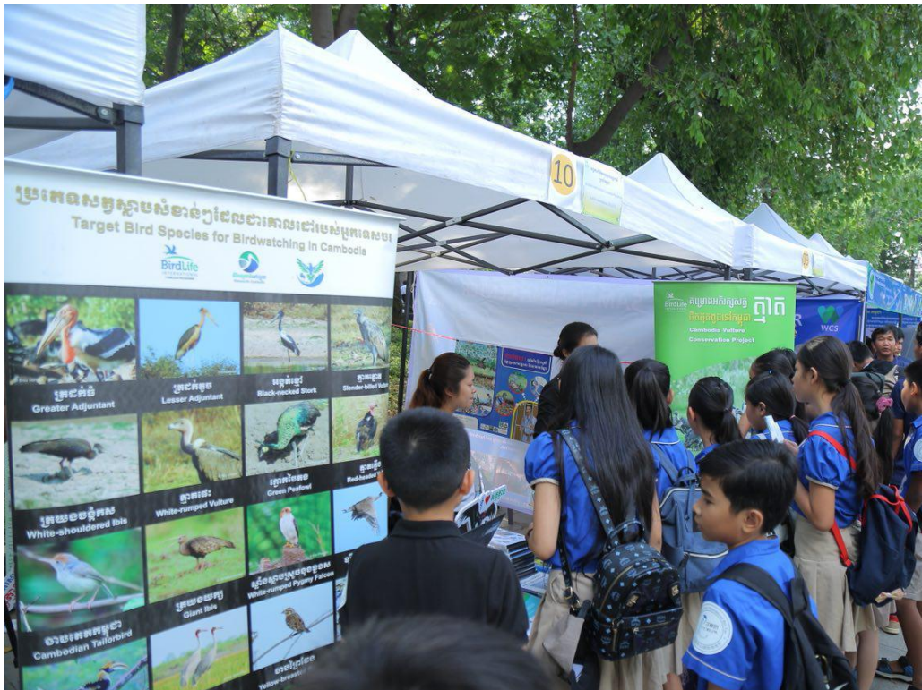
សកម្មភាពក្នុងពិព័រណ៍សត្វស្លាបកម្ពុជាលើកទី១